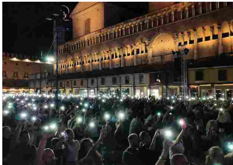
A Ferrara l'estate entra nel vivo con Zuccherò