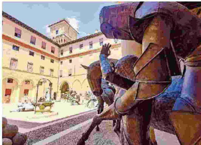
Le sculture sistemate all'interno del Castello Estense