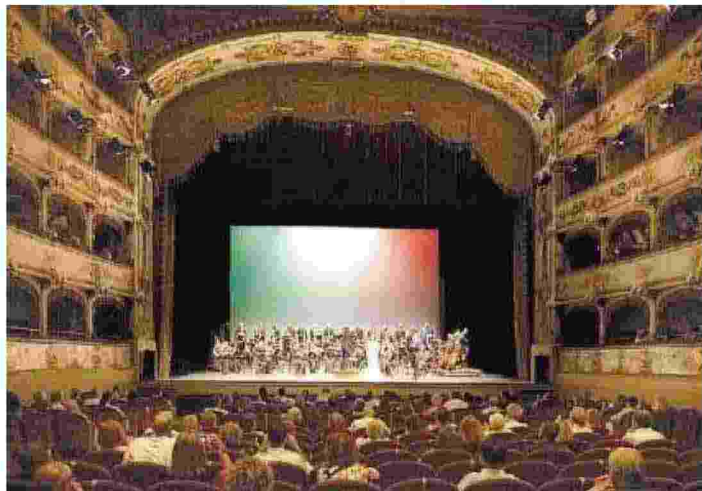
L'interno del teatro comunale intitolato al compianto Claudio Abbado