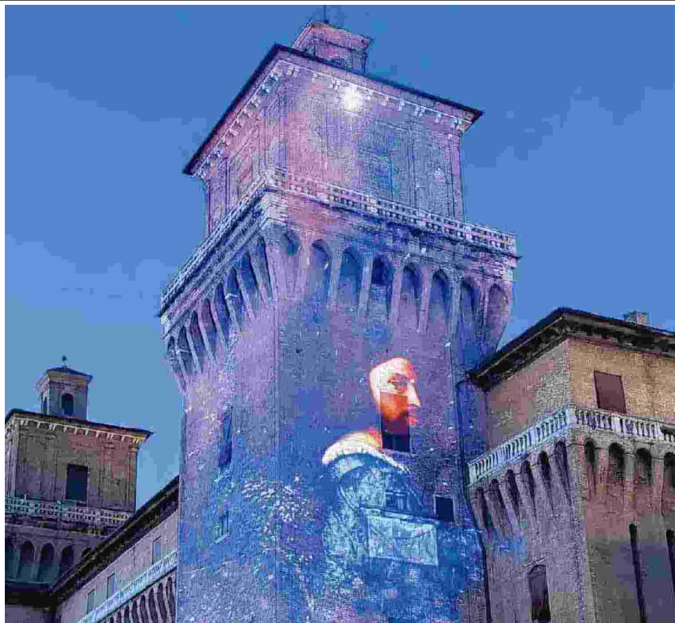
A sinistra uno spettacolo di videomapping sul castello. A destra invece piazza Trento e Trieste gremita durante uno dei concerti del Ferrara Summer Festival che si è concluso di recente. Tanti gli artisti che si sono esibiti sul palco: da Francesco De Gregori ad Antonello Venditti e Max Pezzali. Le serate sul cosiddetto Listone hanno avuto grande successo di pubblico