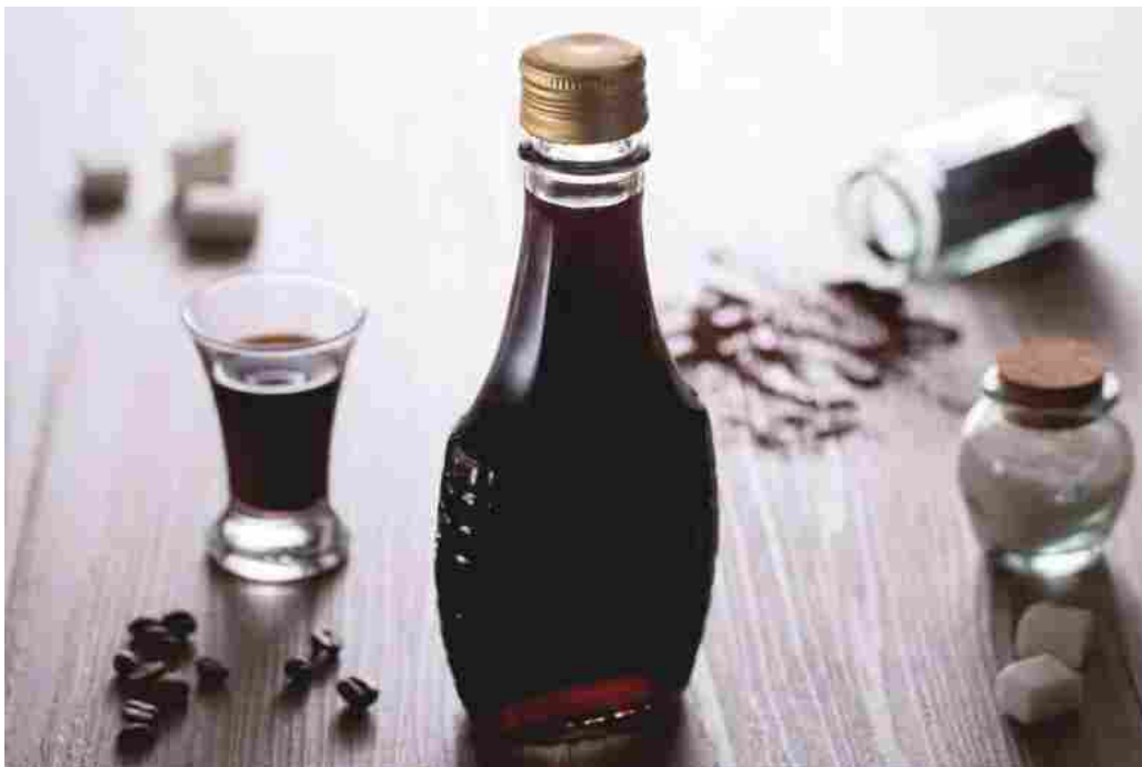
Il liquore al caffè